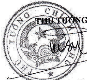
Phạm Minh Chính